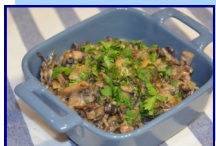
Грибы жареные с луком

Пряники – традиционное русское лакомство, без которого представить русскую кухню невозможно. Появился «медовый хлеб» еще в IX веке, постепенно в тесто начали вводить разнообразные отдушки в виде специй и трав: гвоздики, аниса, муската, тмина, черного перца. К концу XVII века пряники стали отдельным направлением кулинарии.